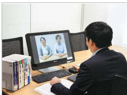
[ テレビ会議システムを利用した税務相談 <イメージ> ]

この度、営業担当者が携帯するiPadを活用することで、お客様はご自宅にいらながら、税理士に相談していただくことができるようになりました。